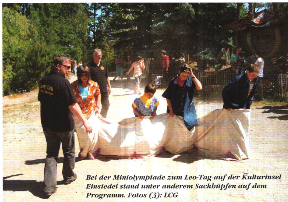
Bei der Miniolympiade zum Leo-Tag auf der Kulturinsel Einsiedel stand unter anderem Sackhüpfen auf dem Programm.