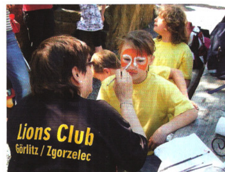
Basteln, Schminken, etc.: Zum Leo-Tag wurde den Kindern so einiges geboten.