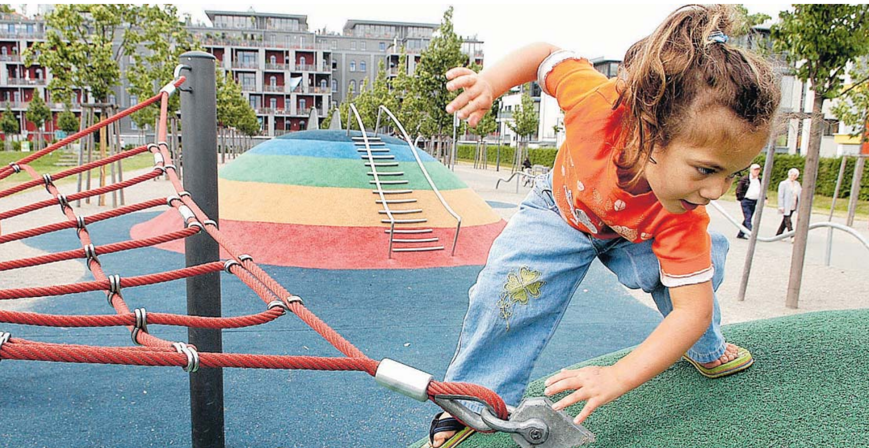
Vier Mal Fürther Spielplätze: Das kleine Mädchen erklimmt einen Hügel im Südstadtpark, während sich eine Jugendliche im Stadtpark entspannt schaukeln lässt. Am Spielplatz an der Uferpromenade wurde gerade Rollrasen verlegt. Die rot-weiße Hasenwippe steht indes in der Konrad-Adenauer-Anlage. Fotos: Hans-Joachim Winckler, Horst Linke (1).