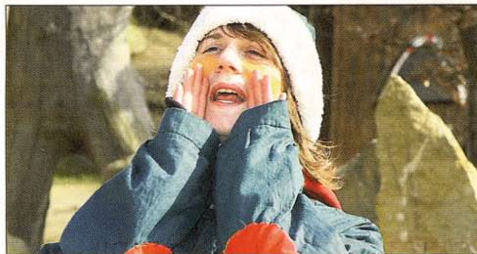
Laut erschallt der Frühlingsweckruf, um die Zentendorfer Inselgeister aus dem langen Winterschlaf zu holen.