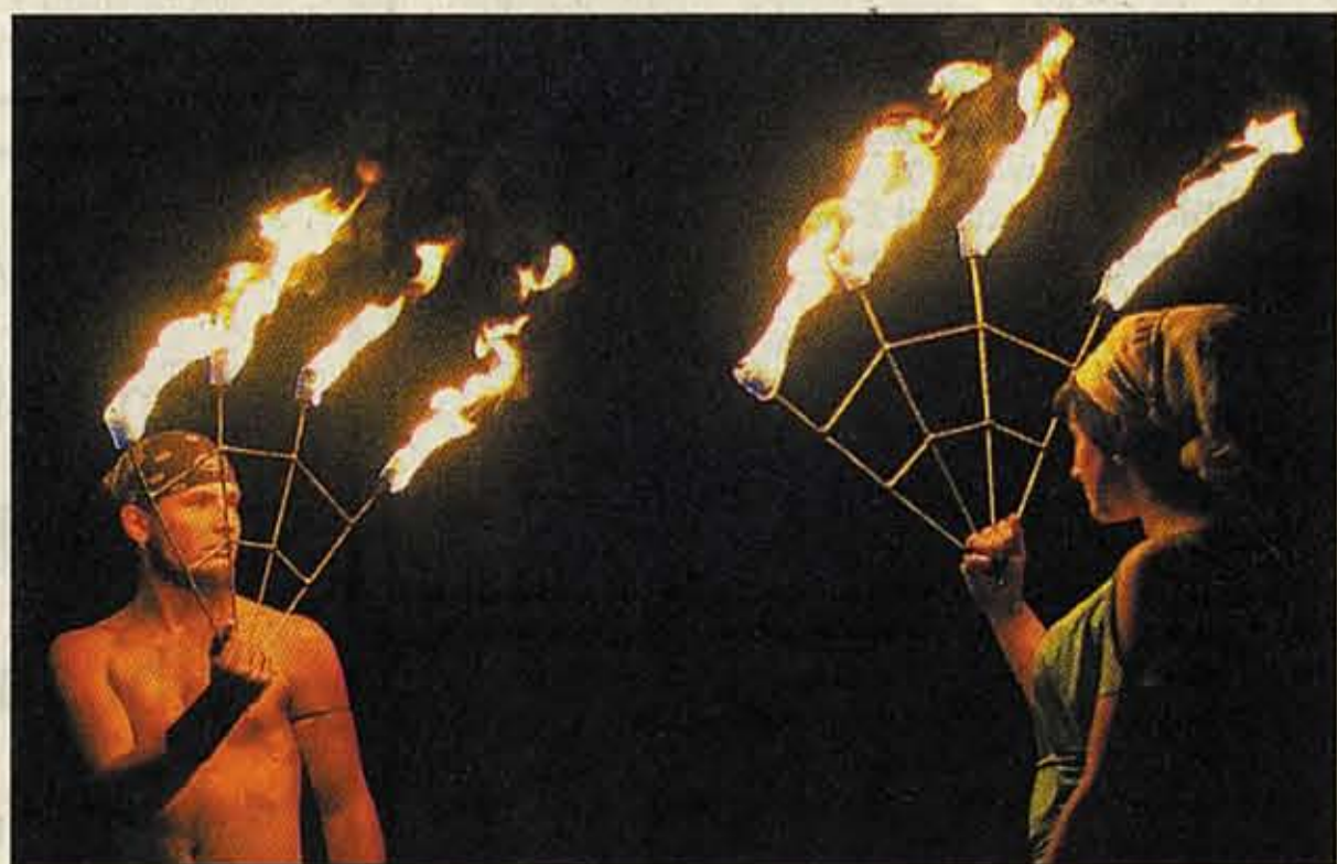
„In signo ignis“ – Feuer- und Maskentheater aus Chemnitz.